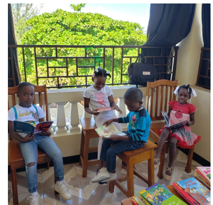
Kat nan manb club syans SantRova yo k ap fè lekti_ete 2022

tankou yon endis apatenans. Anplis yon mwayen kominikasyon, lang se kanal ki eksprime kilti epi li se medyatè idantite. Piske lang se yon konpozant esansyèl nan idantite, alò li dwe yon prewokipasyon egzistansyèl nan pwosesis dekolonizasyon an.