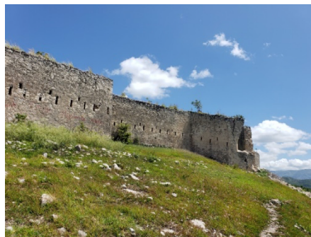
Sa se youn nan fò Machan Desalin yo

e tout sa ki merite fèt dwe byen fèt. Se sa k fè aprè endepandans, li te ini nwa ak milat yo e mete fen nan divizyon tè paske nasyon an se yon sèl. Li te kontwole lanmè ak fontyè nou yo, etabli jistis sosyal ak yon politik agrè pou alinye endepandans politik la ak ekonomi an. Eleman sa yo t ap pèmèt nou evolye e kontwole peyi a totalman. Men malgre li te fè pèp la travay lajounen kou lannwit, li pa t abouti a tout, akòz lènmi l yo te trayi l e asasine l sou pon wouj.